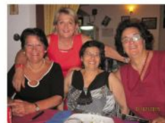
le amiche di Ali Terme e Pesaro.