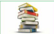
Book in Time