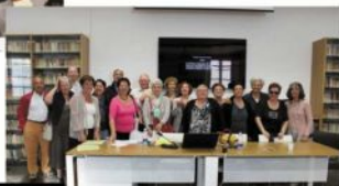
Alcuni partecipanti all'assemblea