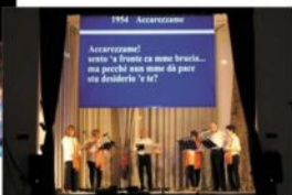
Un momento dello spettacolo