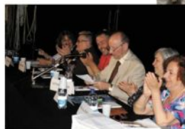
Momenti del convegno