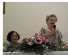
la Presidente della BdT di Ali Terme e la Presidente Nazionale delle BdT

Con la guida delle socie di Fiumefreddo è stato possibile visitare la Città di Catania e gustare la granita locale.