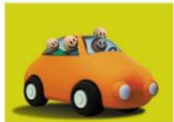
Passaggi in auto